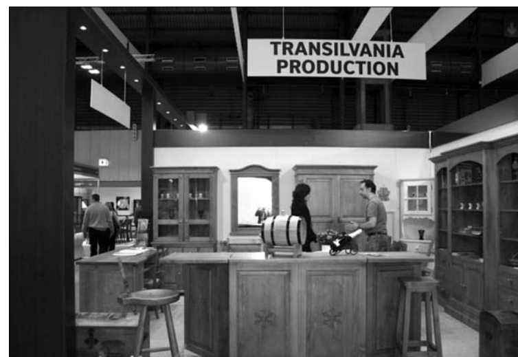
Furniture Show bútorkiállítás Birminghamben – 2006. A bútorgyártásban elismert 11 romániai cég volt jelen az eseményen a GKM támogatásával

A vásárokon és kiállításokon való részvétellel kapcsolatos szolgáltatási szerződések megkötésével, finanszírozásával és lebonyolításával járó feladatokat a Gazdasági és Kereskedelmi Minisztérium a Román Kereskedelem-fejlesztési Központra ruhazza át.