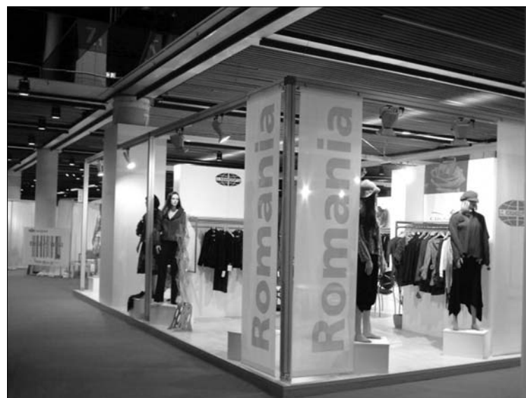
Hazai cégek Düsseldorfban a CPD készruha-kiállításon 2006-ban. 22 romániai cég vett részt a rendezvényen és mintegy 1.474.572 euró összértékben írtak alá exportkötelezettségi szerződést a kiállítás nyomán